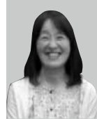
林 千智 はやし ちさと

南伊勢町生まれ。南伊勢町長。1969年三重県庁入庁後、予算調整課長、政策部副部長、環境森林部長、県立病院事業庁長などを歴任。2009年10月の南伊勢町長選挙で初当選、2013年11月に再選。「町民起点のまちづくり」の基本理念のもと、「安全・安心を実現し、希望をもち誇れる南伊勢町」をめざして町づくりをすすめている。