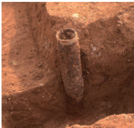
博物館敷地内のヲノ坪遺跡から見つかった地面に突き刺さった焼夷弾 昭和20（1945）年