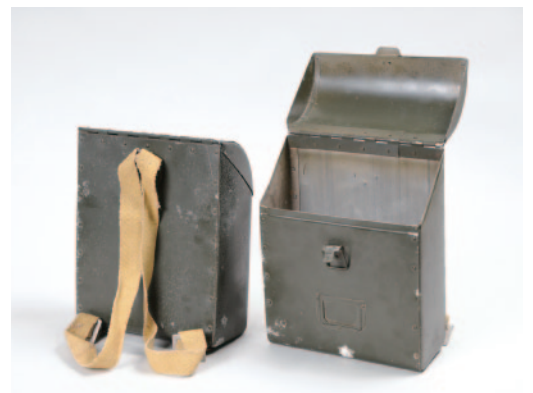
航空機の部品をつくりかえて作ったランドセル 昭和21（1946）年

〒514-0061 三重県津市一身田上津部田3060 三重県総合博物館（MieMu） 「親子で平和を考えるワークショップ」係 e-mail：MieMu@pref.mie.jp