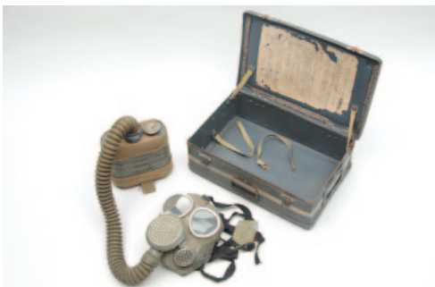
旧海軍が使用していた防毒マスク 昭和15～20年頃（1940年代）