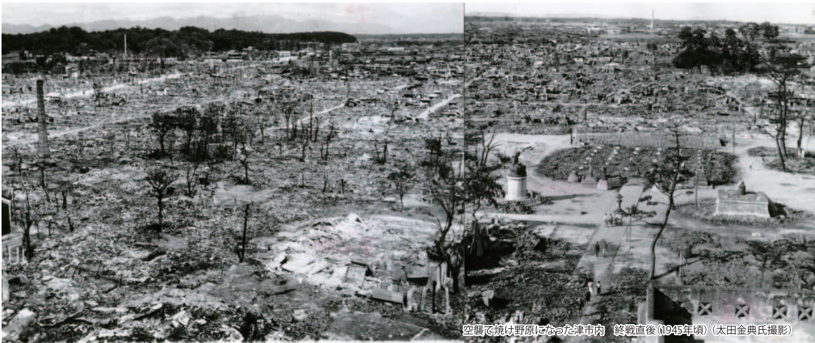
空襲で焼け野原になった津市内（終戦直後（1945年頃）（太田金典氏撮影）

太平洋戦争末期には、本土空襲が激化し、国内の多くが焼け野原になり、たくさんの方が犠牲となりました。特に1945年6月から7月にかけての空襲では、三重県内でも6500人以上の方が亡くられました。また、津、四日市、桑名、宇治山田は被害が大きく、市街地のほとんどが焦土と化しました。平和な暮らしが失われ、死ととなりあわせの日が続いていたあの頃から70年の歳月が経過した現在、戦争のあとを目にしたり、戦争を実体験された方々からお話を聞く機会はたいへん少なくなってきました。しかし、今もなお、私たちの身近なところにも戦争のキズあととは深く残っています。戦後70周年を迎えるにあたり、三重県総合博物館（MieMu）では、県内各所に残る戦争遺跡や、戦争中の暮らしなどについてご紹介するトピック展を開催いたします。本展が戦争の悲惨さや、平和の尊さについて考えるきっかけとなれば幸いです。