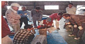
10月5日森林講座 チェーンソー講習