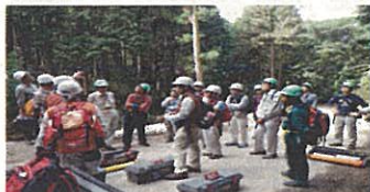
10月4日森林講座 座学