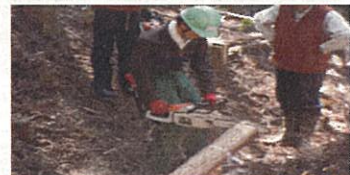
10月19日森林講座 間伐体験