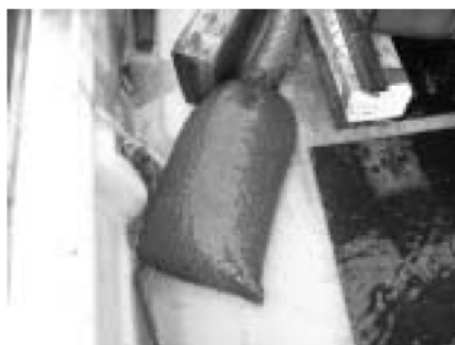
写真2 ナイロンネットによる濾過

著者らの調査により、アコヤガイの洗浄作業に伴う英虞湾への負荷が、以前に算出された値に比べてかなり少ないことが判明したが、自家汚染と称されるように、環境保全を訴えている漁業者自らが発生させている汚染でもあり、量の多寡にかかわらず漁業者自身が削減に取り組まなければならない課題である。