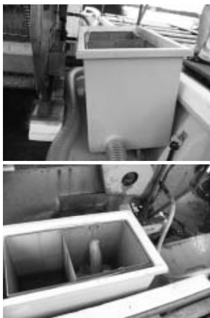
写真1 アコヤガイ洗浄排水処理装置

9月9日の試験では、1次フィルターを開口3.1mmと目合いの大きなものに換え、2次フィルターを前回同様の0.77mmとし、76.6 l/分の水量で48個入りのタテ籠を洗浄した。この条件でも、通常貝掃除で要求される30分間の作業時間で、50吊り程度のタテ籠を洗浄するという条件は満足できなかった。そこで、2次フィルターをはずし、代わりに開口1.6mmのナイロンネットを排水ホースの先端に設置し、同じ条件で洗浄作業を行ったところ、ネットを足で踏むことで目詰まりが解消でき、手を掛けることなく30分間で50吊りの洗浄が可能であった。