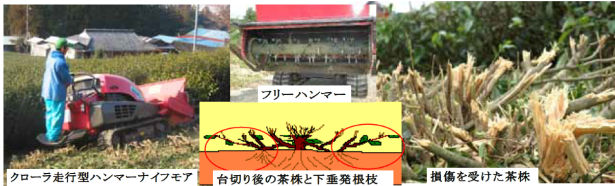
図1 クローラ走行型ハンマーナイフモアと台切り後の茶株