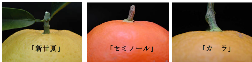
図1 主な中晩柑のへた部の形状（果皮からの突出度合い）