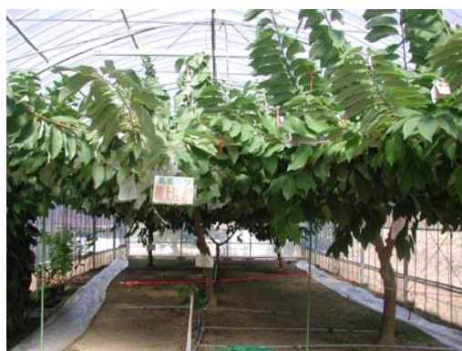
写真1 アテモヤの平圃栽培

注) 新梢長はH15/7/17時点の平均長、3樹の平均。 果実重及び糖度、酸含量は樹上着生日数140日以上のも のを使用、平均155日、随時収穫調査、3樹の平均。 最小有意差法により英小添字異符号間に有意差あり(*5%)