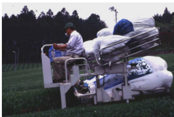
写真1 小型乗用摘採機