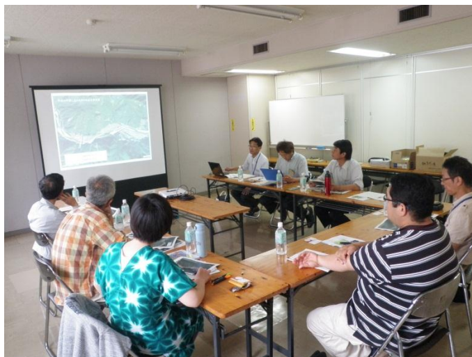
生態系保全対策検証委員会(H27.5.28)の様子

生態系保全対策検証委員会とは、県営中山間地域総合整備事業紀北地区において整備したホテル等の生態系に配慮した施設について、事後調査をするための手法検討や今後の生態系保全対策に必要な助言を得ることを目的とした委員会です。