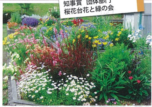
知事賞 団体部門 桜花台花と緑の会