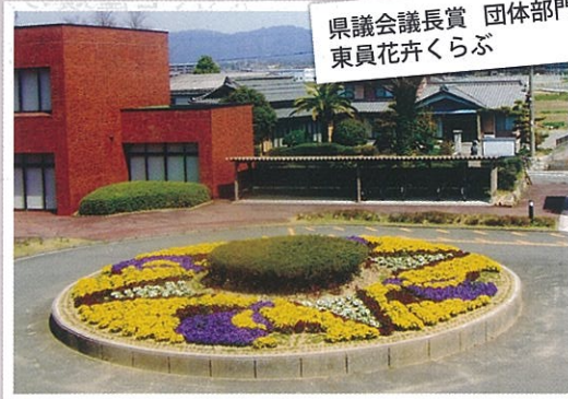
県議会議長賞 団体部門 東真花卉くらぶ