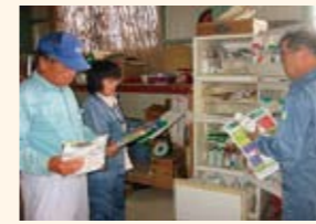
農薬、動物用医薬品など 適正使用の指導