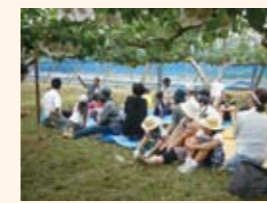
食の安全・安心交流会

県民、食品関連事業者、行政など多様な主体が連携・協働して食の安全・安心確保に取り組む県民運動を進めます。