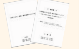
品質衛生管理 マニュアルなど