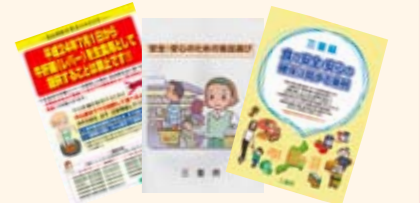
ホームページ、パンフレット 啓発グッズなど