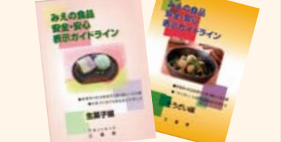
みえの食品安全・安心表示 ガイドラインなど