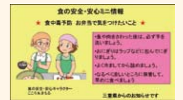
ミニ情報の掲載協力