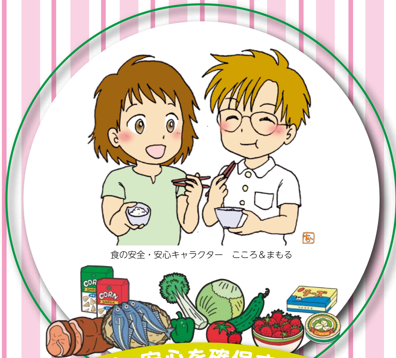
食の安全・安心キャラクター ころろ&まもる