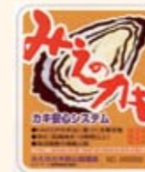
「みえのカキ安心協議会」 による自主衛生管理

食品関連事業者が主体的に食の安全・安心確保に取り組みやすい環境を整備し、取り組みを支援します。