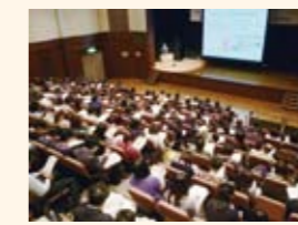
リスクコミュニケーション