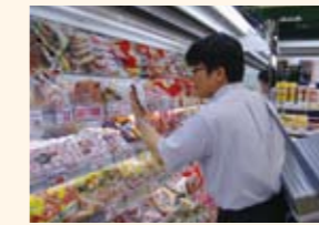
食品収去検査、食品表示の 適正化指導