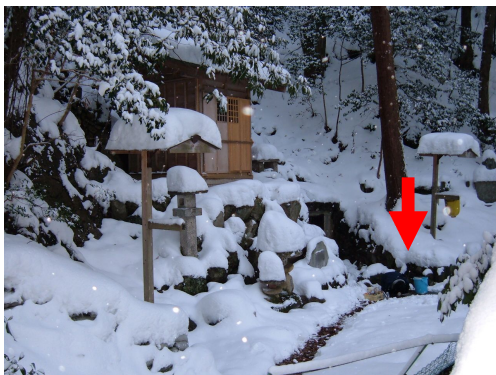
写真1 湯の山温泉の源泉での採水作業。赤い矢印は、湧出口を示しています。湧出口近くには「ほくら」が建てられています。標高が高いため、積雪が多い地域ですが、温泉の湧出口と配湯管の付近だけは、雪がとけています。

県内の温泉地の中でも、三重郡菰野町の一帯は、湯の山温泉をはじめとする温泉資源にとっても恵まれた地域です。特に、菰野町西部の山岳地域は、鈴鹿花崗岩と呼ばれる風化花崗岩に富んだ地域であり、花崗岩を湧出母岩とする温泉が、至るところに湧出しています。