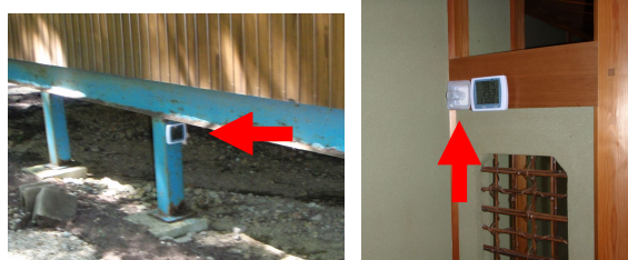
写真2 空気中ラドンを測定する検出器を設置した様子。同地域一帯の屋内や屋外に検出器を設置しました。検出器内には、空気中ラドンを捕集するための活性炭が装着されており、一定時間の捕集の後に、実験室内の測定機器で分析します。

分析の結果、温泉の湧出口付近で高いラドン濃度が得られただけでなく、浴室以外の利用施設内でも相当量のラドンが存在することが明らかになりました。