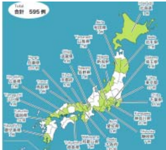
日本の流行地図

我が国の大阪府内の高校における確定症例64例の調査では、38以上の発熱83%、咳81%、他に悪寒、咽頭痛、鼻汁・鼻閉、頭痛、下痢、腹痛、嘔吐等、季節性インフルエンザに類似した臨床像を示しており、重篤な症例はありませんでした *2 。