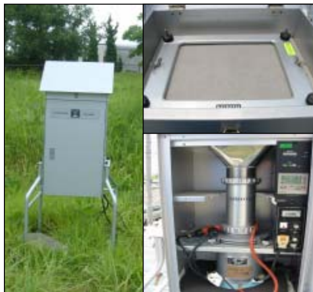
図1 ハイポリウムエアサンプラー

図1に示すハイポリウムエアサンプラーという装置でフィルター上に捕集を行います。この装置は、大型の掃除機のようなもので1分間に約1,000Lの大気を吸引します。図2にサンプリング前と24時間サンプリング後のフィルターを示します。保環研では、フィルターに捕集されたB(a)Pという物質を抽出・濃縮して測定を行っています。