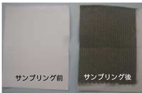
図2 サンプリング前後のフィルター