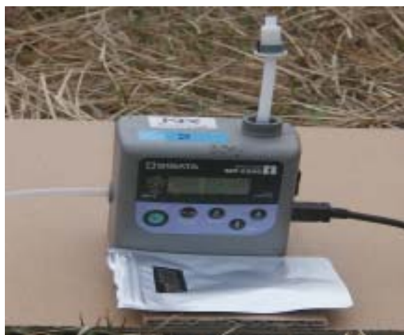
図5 大気試料サンプリングポンプ

図5に示すサンプリングポンプに、図6に示す各種の捕集剤を対象物質の性質に応じて選択し、最適な吸引速度を設定して採取を行います。