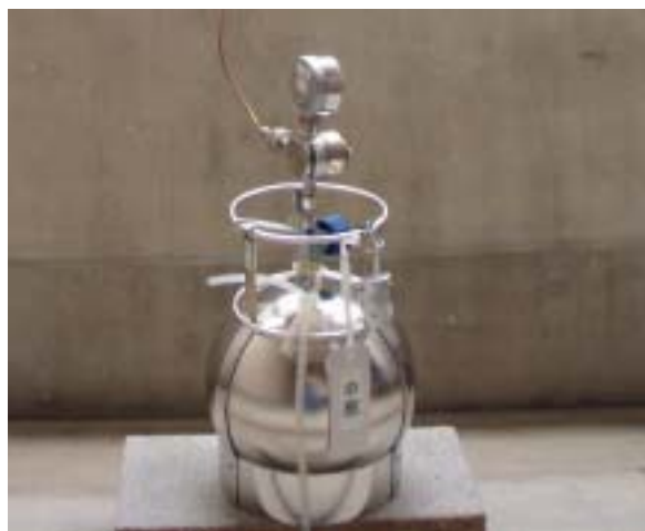
図3 キャニスターによるサンプリング

図3に示すキャニスターと呼ばれる捕集容器に1分間に3mL程度の流速で24時間大気捕集を行います。