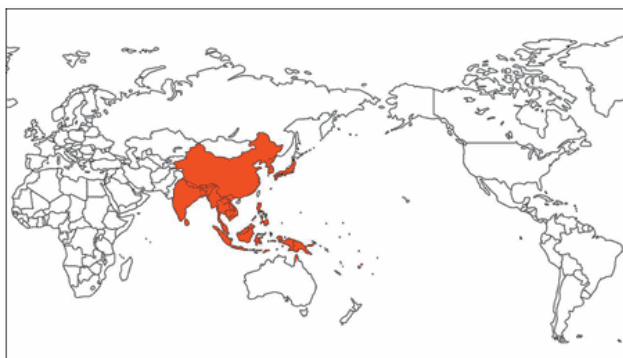
図1 日本脳炎発生地域

熱帯地方ではマラリア等がよく知られていますが、日本では「日本脳炎」が著明な疾病です。日本国内で1960年代までは年間数百人の死亡者が出ていましたが、ワクチン接種の普及により年間の死亡者数は現在では数人程度まで激減しました。しかし、夏期にはウイルスを持った蚊の存在が確認されていますので、感染するリスクは依然として存在しています。蚊に刺されてもウイルスが体内に侵入しなければ感染しませんし、ワクチンで予防できる疾病ですので、蚊に刺されないようにするとともに、ワクチン接種による予防をすることが重要です。