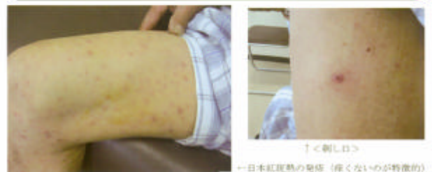
図2 日本紅斑熱予防啓発パンフレット

ライム病については本州中部以北に多いとされており、三重県では旅行に行かれた方が帰ってきて発症する事例が報告されています。