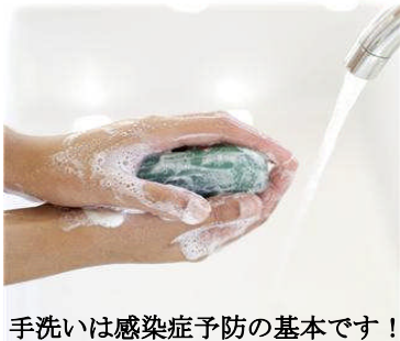
手洗いは感染症予防の基本です！

ウイルス性胃腸炎を予防するワクチンとしては、唯一ロタウイルスのワクチンが開発されています。国内においても、昨年の秋から接種が可能になりました。任意接種となっていますので、かかりつけの医師にご相談ください。