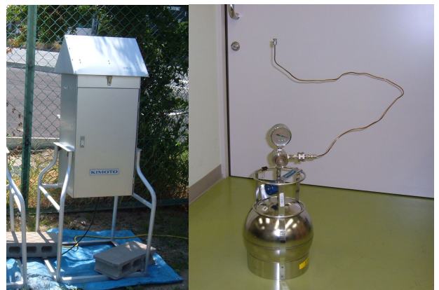
図1 大気採取機器 (ハイボリウムエアサンプラー(左)、キャニスター(右))