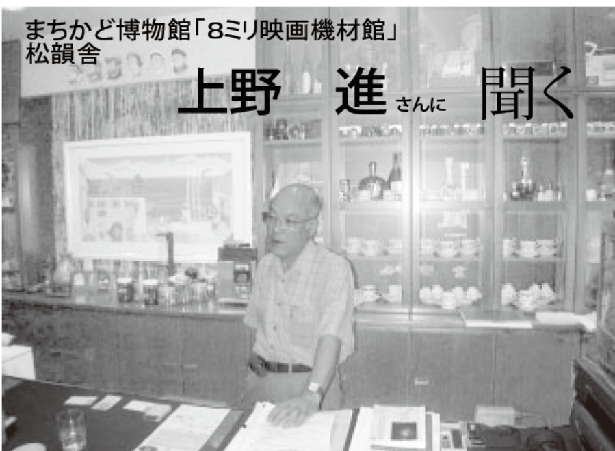
まちかど博物館「8ミリ映画機材館」 松韻舎