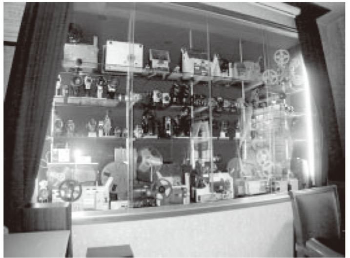
ずらりと並ぶカメラや映写機。

……知人が集まって、長居をすると喫茶店主としては困るのでは? 全然商売になりませんね。もともと商売にならぬとは思っていましたがその通り。赤字を年金内でやりくりして、いかに交流の拠点を守