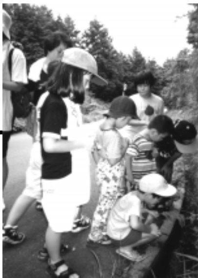
昨年の夏に行われた「たんぼぼクラブ」のキャンプ。自然観察を楽しみました。

そうです。去年の4月に環境庁の子どもエコクラブに登録して始めました。子どもの時から自然に親しみ、すべてのものに命があるとわかっている子どもたちなら、平気でその命を壊すような大人にはならないと思うんです。「たんぼぼクラブ」という名前は子どもたちが考えてつけてくれました。2年目になる今年は人数がちょっと増えそうなんです。去年の話聞いて来た子がいるんです。20人越えたらきめ細かな活動ができないから、別の場所にもう1つつくってもらおうって話してます(笑)。