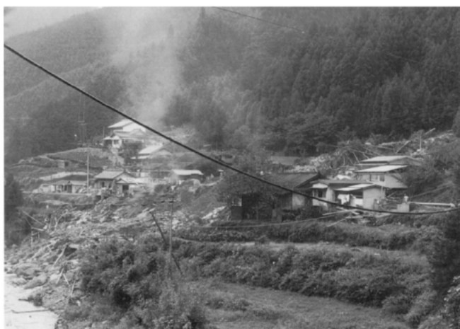
昭和51年9月8日～9月13日の台風17号と前線による大雨 (松阪市飯高町)