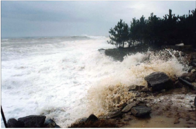
平成9年7月26日の台風9号 (紀宝町井田海岸)