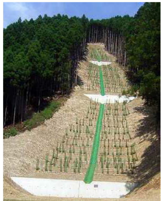
復旧後 (治山激甚災害対策特別緊急事業)