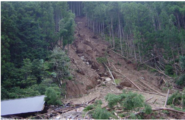
崩壊状況 (大台町(旧宮川村))