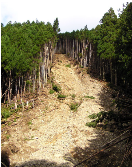
崩壊状況 (大台町(旧宮川村))