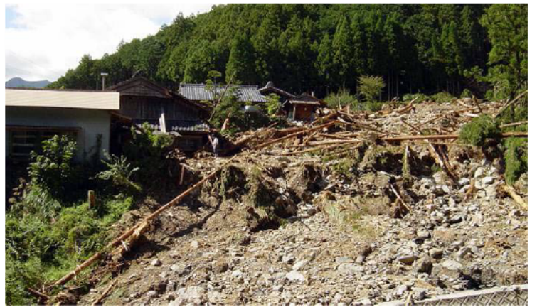
平成16年9月28日～9月30日の台風21号と前線による豪雨 (大台町(旧宮川村))