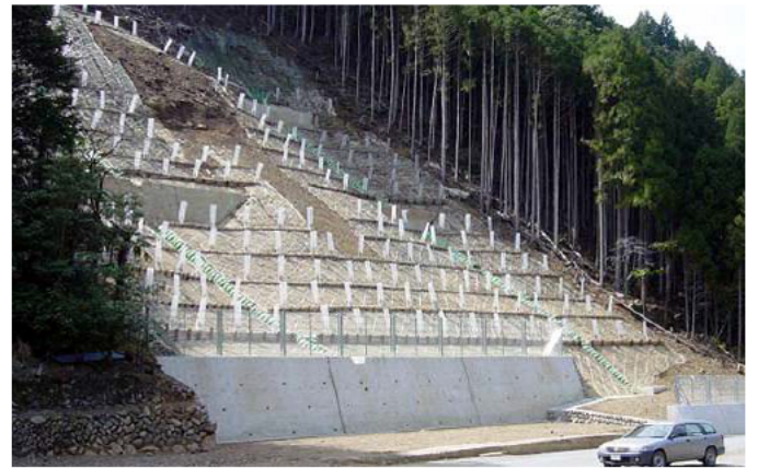
復旧後 (災害関連緊急治山事業)