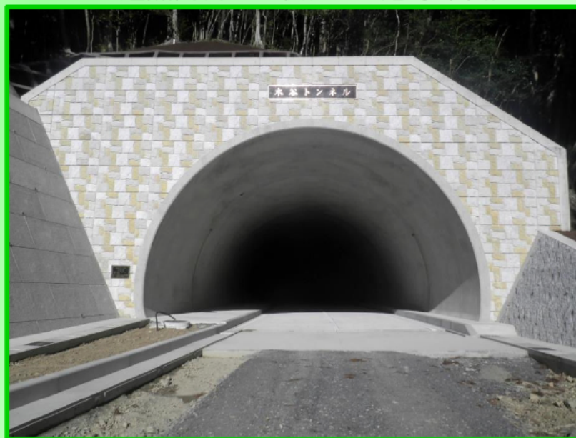
＜起点側坑口の状況＞（志摩市側）