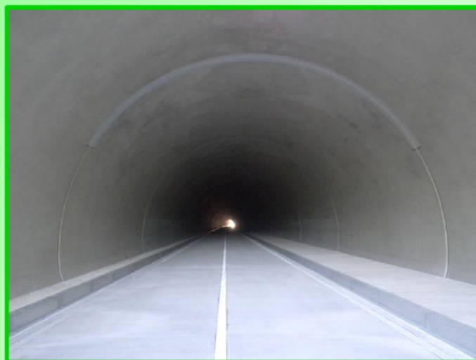
＜終点側付近＞（南伊勢町側）