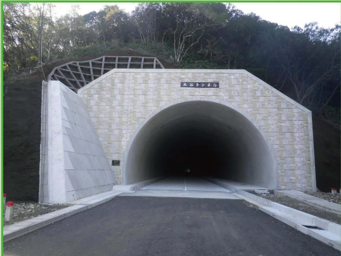
< 終点側坑口の状況 > （南伊勢町側）