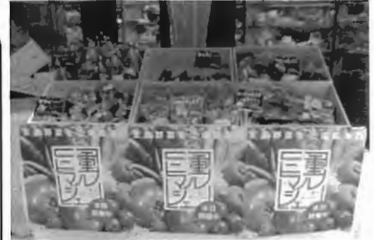
新浮世小路でのマルシェ