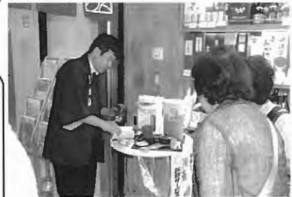
新茶の試飲・販売