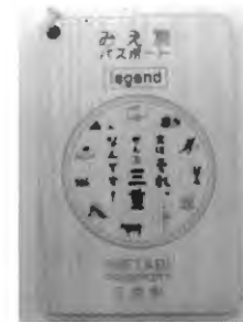
【記念木製プレート】