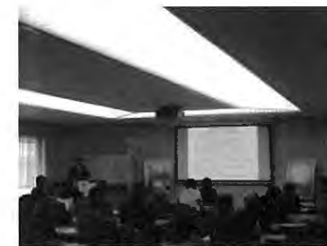
【平成25年度セミナー風景】