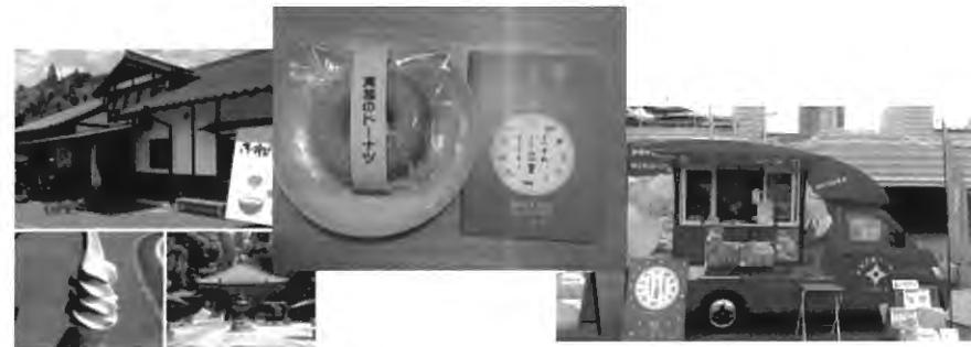
【みえ旅おもてなし施設でのサービス：割引・プレゼント等】