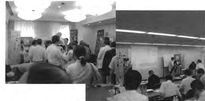
【平成25年度情報提供会風景】