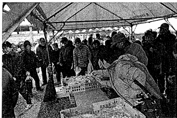
三重外湾漁協と障がい者が「今一色のり祭」で 鮮魚販売する様子