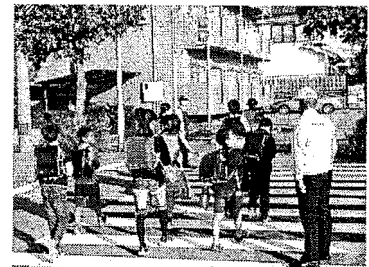
見守り活動の実施状況