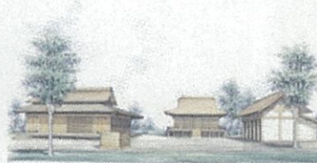
史跡斎宮跡東部整備