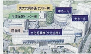
三重県総合文化センター