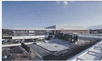
三重県総合博物館