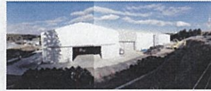
桑名市五反田事案

生活環境保全上の支障等のある4事案について、産廃特措法による国の支援を得て恒久対策を実施していきます。