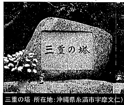
三重の塔 所在地: 沖縄県糸満市字摩文仁