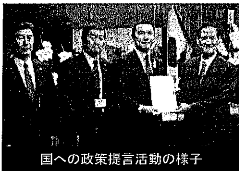
国への政策提言活動の様子

中部圏知事会、近畿ブロック知事会及び東海三県一市の知事会等に参画して、連携事業や国への提言活動を実施します。