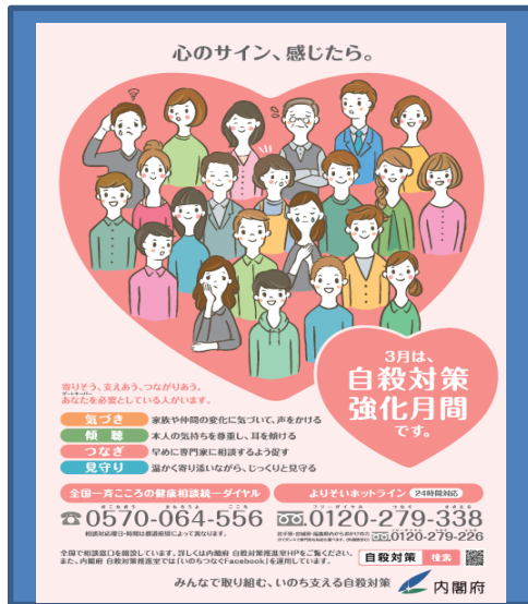
平成 27 年度 自殺対策強化月間ポスター

「誰も自殺に追い込まれることのない社会」を実現するためには、自殺について誤解や偏見をなくし、正しい知識の普及啓発が大切です。このため例年、月別の自殺者数が最も多くなる3月を「自殺対策強化月間」として、国・地方公共団体・関係団体・民間団体等が連携して啓発活動を行っています。