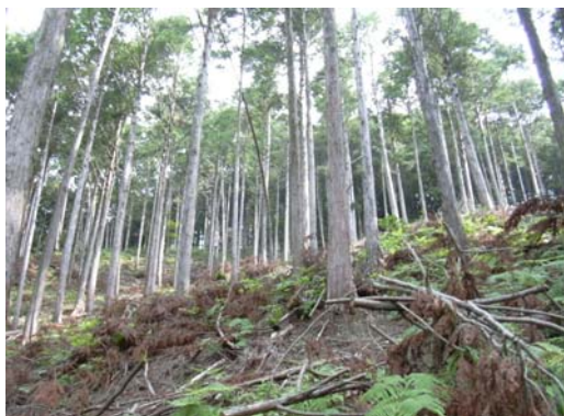
間伐を実施した林分