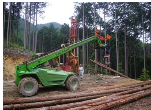
高性能林業機械を使用した木材生産