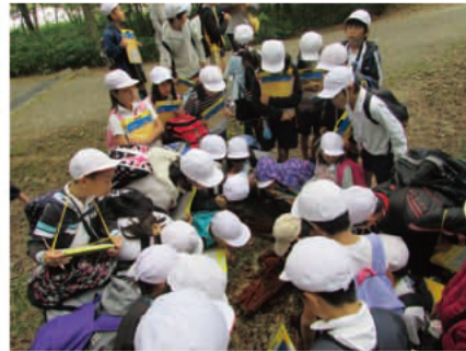
朽ち木の中にいた虫たちを観察。