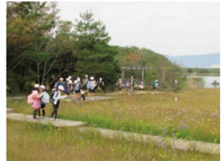
サギソウ園の湿地で希少種探しのクイズと湿地について学びました。