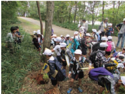
森の観察。何を発見するかな？

3班に分かれて、3つのエリア「森と虫」「水生生物」「ネイチャークラフト」を順番に体験しました。「森と虫」エリアでは、森の土に注目して、菌類や虫の観察をしたり、お話を聞いたりしました。また、湿地の希少種をクイズ形式で探し、絶滅危惧種について学びました。「水生生物」エリアでは、プランクトンや水生生物の観察をしました。「ネイチャークラフト」では、園内に生えているネジキを材料にペンダントを作り、ネジキという木や里山について学びました。3つの体験を通して、子どもたちは五感をフル活用して動植物とふれあい、森のしくみやはたらきなどについて真剣に考え、理解が深まったようでした。