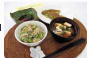
朝食メニューコンクール 小学生の部最優秀受賞作品