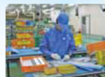
製造現場での実習