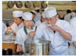
スペシャリストをめざす生徒たち