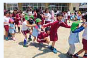
幼児と小学生のふれあい活動