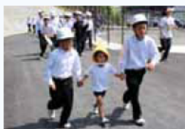
中学生と幼児の合同避難訓練