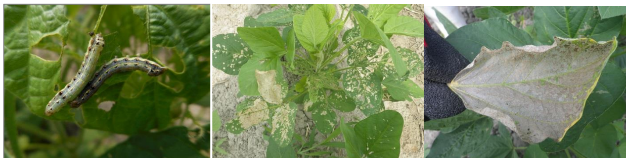
（写真）ハスモンヨトウ幼虫（左図）、ダイズの食害状況（中央図）、ダイズの白変葉（右図）