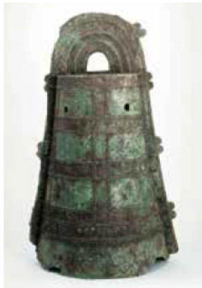
津市指定文化財 高茶屋銅鐃