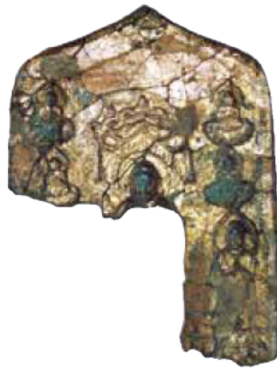
三重県指定文化財 鳥居古墳 金銅装押出仏