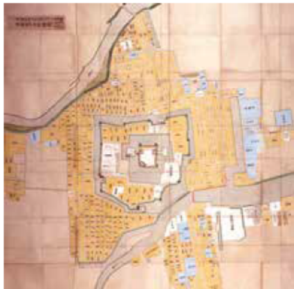
津城下絵図 享保4(1719)年