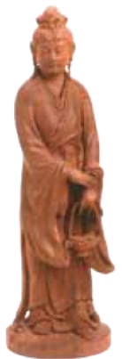
高村光雲 作 魚籃観音立像