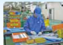
製造現場での実習