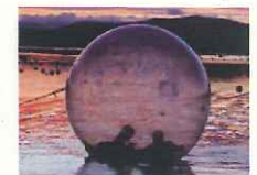
ウォーターボール