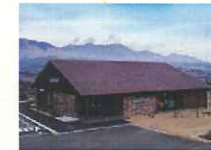
アウトドアスポーツショップ