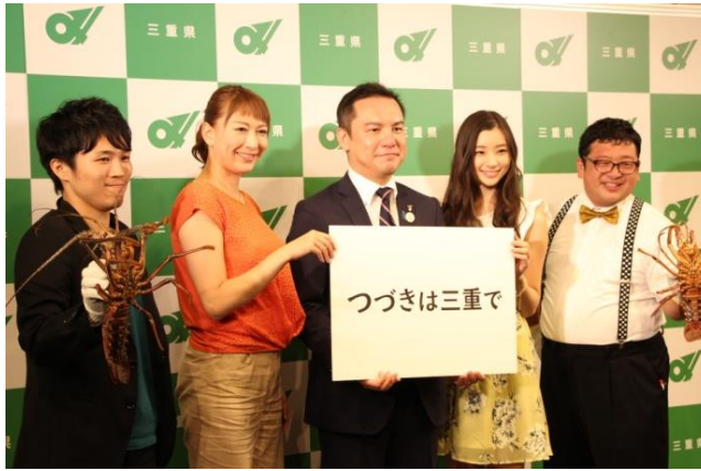
三重県新プロモーション発表会(9/26)

9月28日のオープン2周年を記念して、9月23日から28日に「2周年記念感謝祭」を開催しました。 「赤福茶屋」、「一日店長」、「COOL MIE スペシャルトークライブ」、「三重の応援団のつどい」等の多彩なイベント、レストランにおける旬の特別メニューの提供等を実施しました。 [9/23～28の来館者数 17,147名]