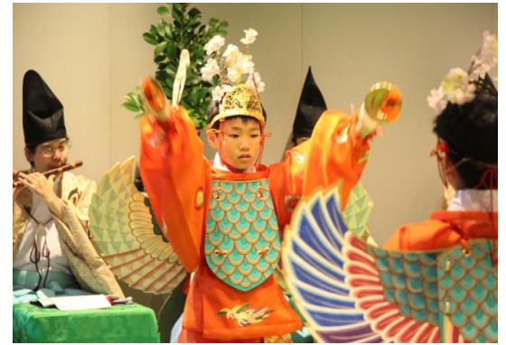
多度雅楽会による「秋の雅楽」(9/26)