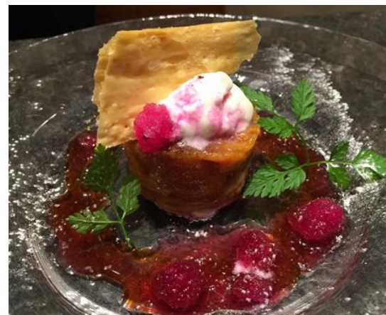
伊勢市との連携によるメニュー開発 (蓮台寺柿のタルトタタン)