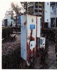
腐食した制御機ボックス（御浜町）