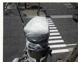
腐食・崩落防止のための応急措置状況 （四日市市塩浜本町交差点（H21年補修、H28年7月崩落））