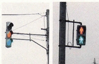
制御機の故障による灯火異常（富山県）

※ 全国では、平成27年中、倒壊事案が8件発生（うち人的被害有2件）。県内では、頭頂部が崩落