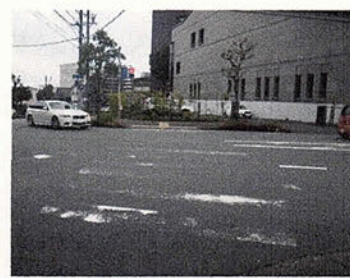
摩耗により機能が著しく低下した横断歩道（県庁西）