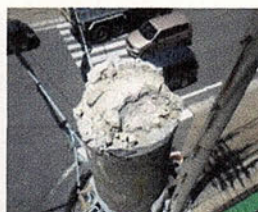
長寿命化補修をした信号柱頭頂部の劣化