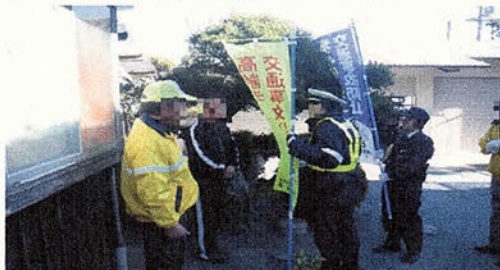
〈高齢者宅訪問活動〉