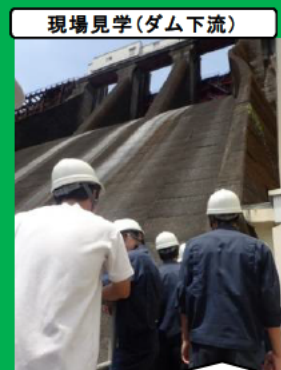
現場見学(ダム下流)