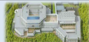
平成29年度開設の県立子ども心身発達医療センターおよび併設する県立かがやき特別支援学校(分校)