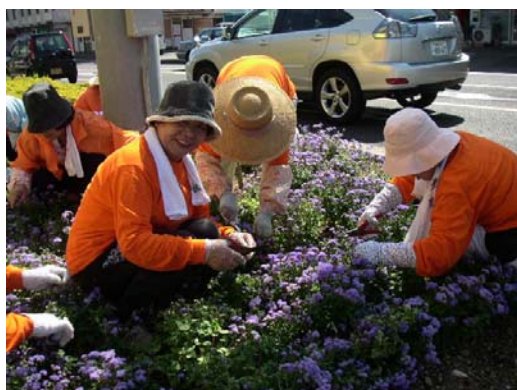
国道沿いの花の管理