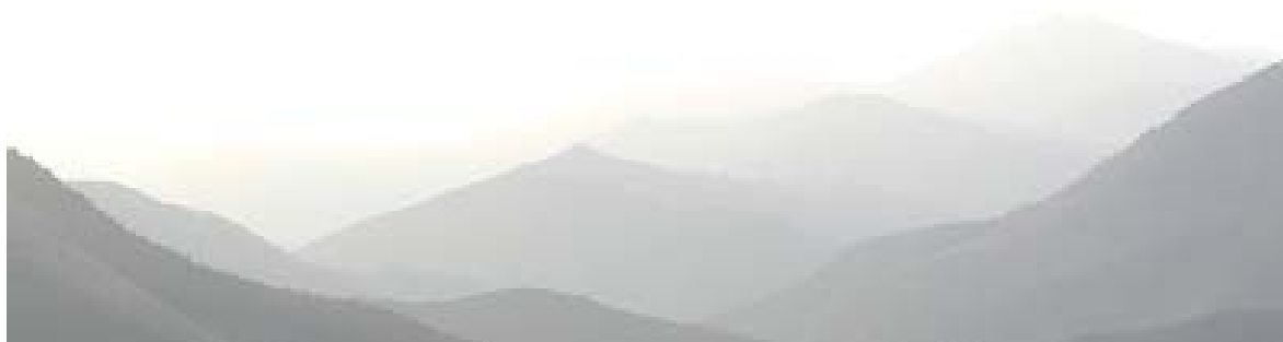
丸山千枚田より、和歌山・奈良方面の山々を望む

そこで、私たちは、訪れる人が魅力を感じ、地元の人が誇りを持つきっかけとするとともに、推進協議会に参加する各々の団体の連携による広く充実した取組を行うため、これまでとこれからの取組をとりまとめ、活動計画を策定しました。