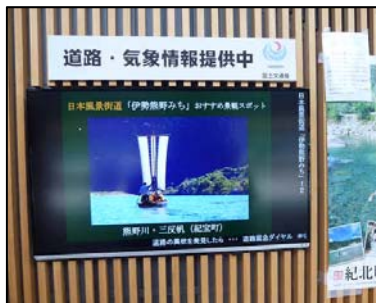
紀北パーキングエリア