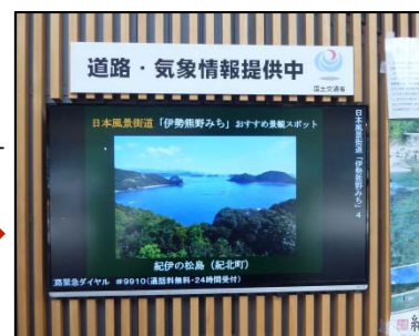
いろんなスポットを紹介