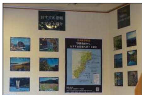
道の駅ウミガメ公園

紀勢国道事務所所管の道の駅（大台町以南、奥伊勢おおい除く）および紀北PAの計7ヶ所のプラズマディスプレイ等を利用し、おすすめ景観スポットの紹介をはじめました。四季ごとのおすすめ景観スポットをご紹介しますので、ぜひご覧ください。