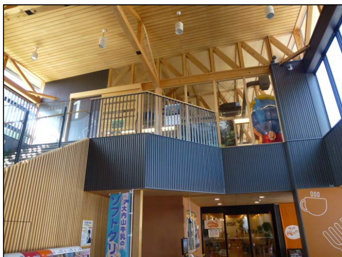
ヒノキを使用した内装