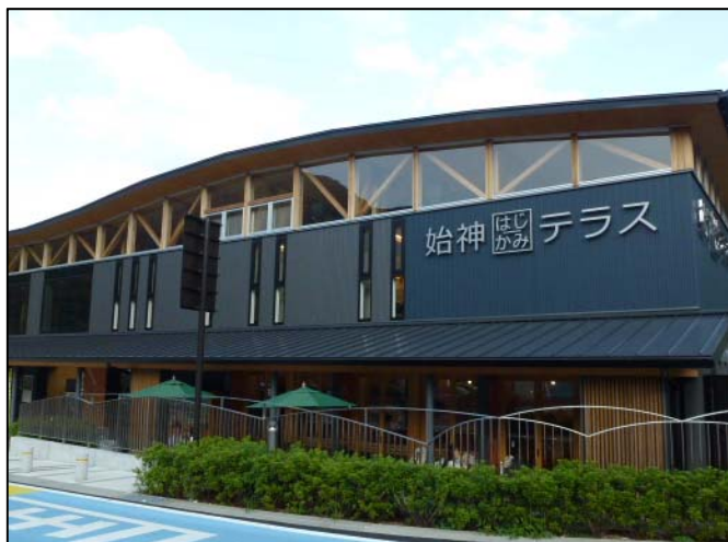
始神テラスの外観