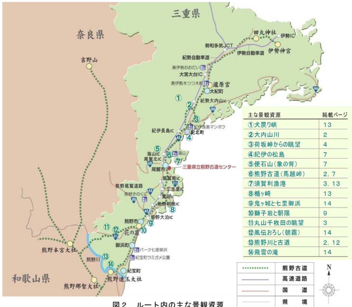
図2 ルート内の主な景観資源

また、本ルートは、熊野古道以外にも主要ルートである 国道42号 や 国道311号 などの移動経路のほか、 来訪者が利用するまちなかの道 についても対象ルートとして考えます。