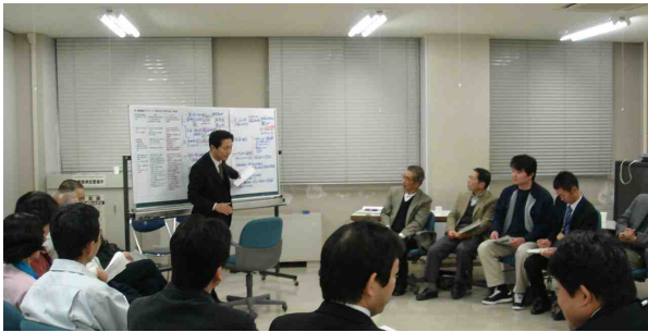
地域別会議の開催状況

今回は、紀南と紀北のそれぞれの地区のメンバーが集まりこれからの活動について話し合いました。今回のニュースレターでは、各地域別会議の概要についてお伝えします。