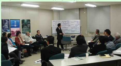
紀南地区のフリートークの状況