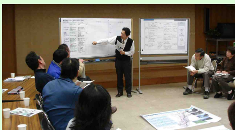
紀北地区のフリートークの状況