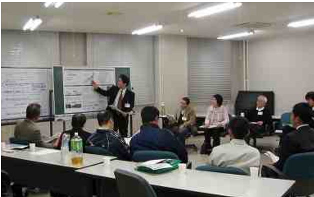
地域別会議の開催状況

前回と同様に、紀南と紀北のそれぞれの地域のメンバーが集まり実施計画案について話し合いました。今回のニュースレターでは、各地域別会議の概要についてお伝えします。