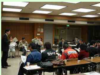
紀北地区のフリートークの状況