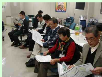
紀南地域のフリートークの状況