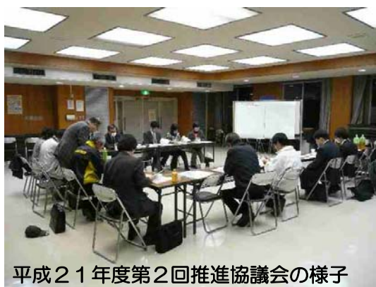
平成21年度第2回推進協議会の様子