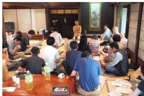
【前回の推進協議会】

活動報告や情報交換の他、受け入れ団体の取組を体験することで、地域の資源や活動について理解を深めることを目的としています。