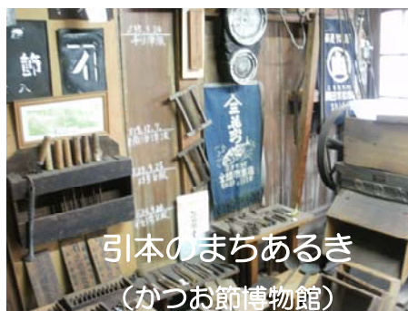
引本のまちあるき (かつお節博物館)