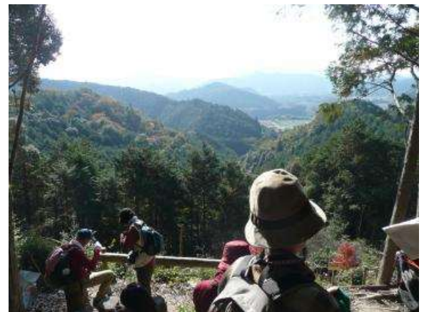
女鬼峠からの景色

多気町では、江戸時代に「伊勢錦」という高級酒米が作り出されました。また、女鬼峠の周辺には江戸時代から続く酒蔵が2軒あります。この2軒の酒蔵を訪ねながら佐那（さな）神社から栃原まで歩き、この地方の歴史や文化を紹介するコースです。