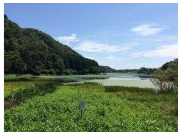
栃ヶ池湿地植物群落

貯水量三重県第一を誇る五桂池や県指定天然記念物「栃ヶ池湿地植物群落」、絶滅危惧種のまめなしの木、標高約200mの光渡山などをゆっくり歩き、のんびりと自然を楽しむコースです。