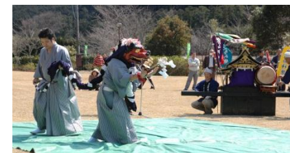
※写真は昨年の様子

日時：平成26年3月21日（祝・金）9時～正午 場所：種まき権兵衛の里（北牟婁郡紀北町海山区便ノ山768）