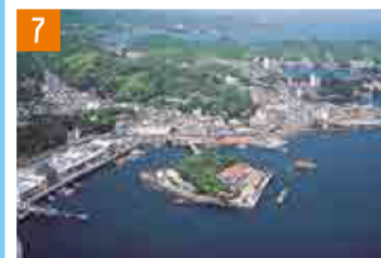
7 三宅モト真珠島 (鳥羽市) 伊勢IC経由 伊勢二見鳥羽ライン 鳥羽ICから車で約5分