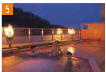
5 榊原温泉 (津市) 伊勢道 久居ICから車で約20分