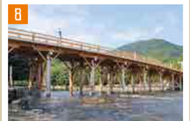
8 伊勢神宮・内宮 (伊勢市) 伊勢道 伊勢西ICから車で約5分