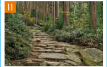
11 熊野古道・馬越峠 (紀北町・尾鷲市) 紀勢道 海山ICから車で約5分