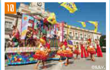
10 志摩スバイコ村 (志摩市) 伊勢IC経由 第二伊勢道 鳥羽南・白木ICから車で約20分