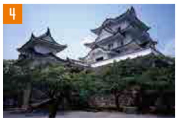
4 伊賀上野城 (伊賀市) 亀山IC経由 名阪国道中瀬Cから車で約10分