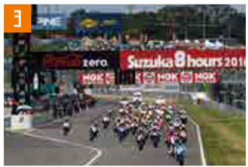
3 鈴鹿サーキット (鈴鹿市) 東名阪道 鈴鹿ICから車で約25分