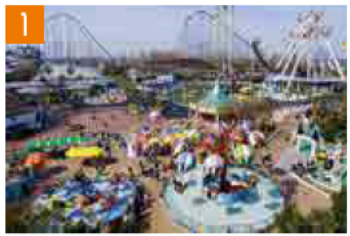
1 ナガシマスパーランド (桑名市) 伊勢湾岸道 湾岸長島ICから車ですぐ