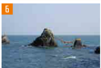
6 夫婦岩 (伊勢市) 伊勢IC経由 伊勢二見鳥羽ライン二見JCTから車で約5分

●三重県の観光情報は「観光三重ホームページ」で https://www.kankomie.or.jp/