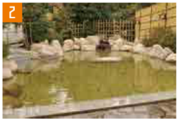
2 たけの山温泉 (菟野町) 東名阪道 四日市ICから車で約30分