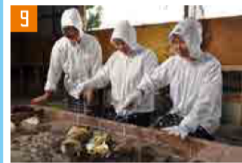
9 海女小屋体験 (鳥羽市・志摩市) 伊勢IC経由 第二伊勢道 鳥羽南・白木ICから各所