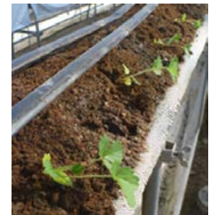
406穴セル苗の本圃直接定植